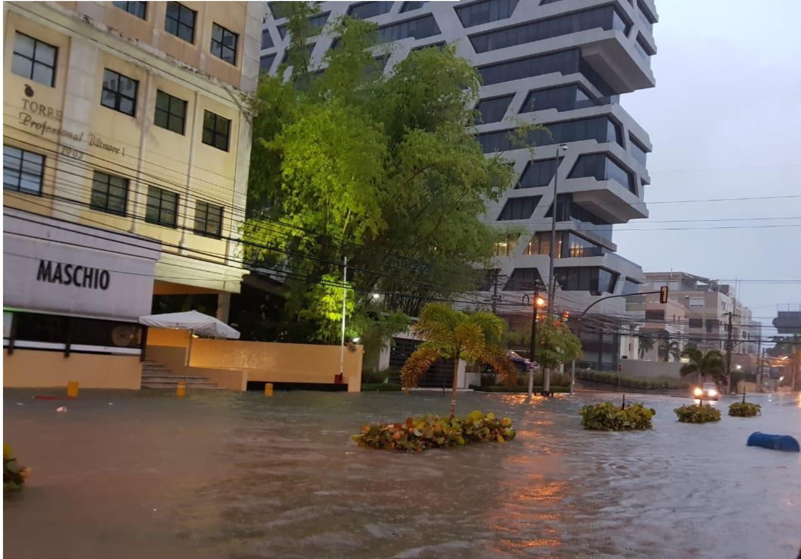
Onda Tropical Beryll

La RD se encuentra entre los 10 países más vulnerables al cambio climático, lo que sin duda se traduce en eventos climáticos que traen consigo inundaciones, sequías, así como devastadores y más frecuentes huracanes.